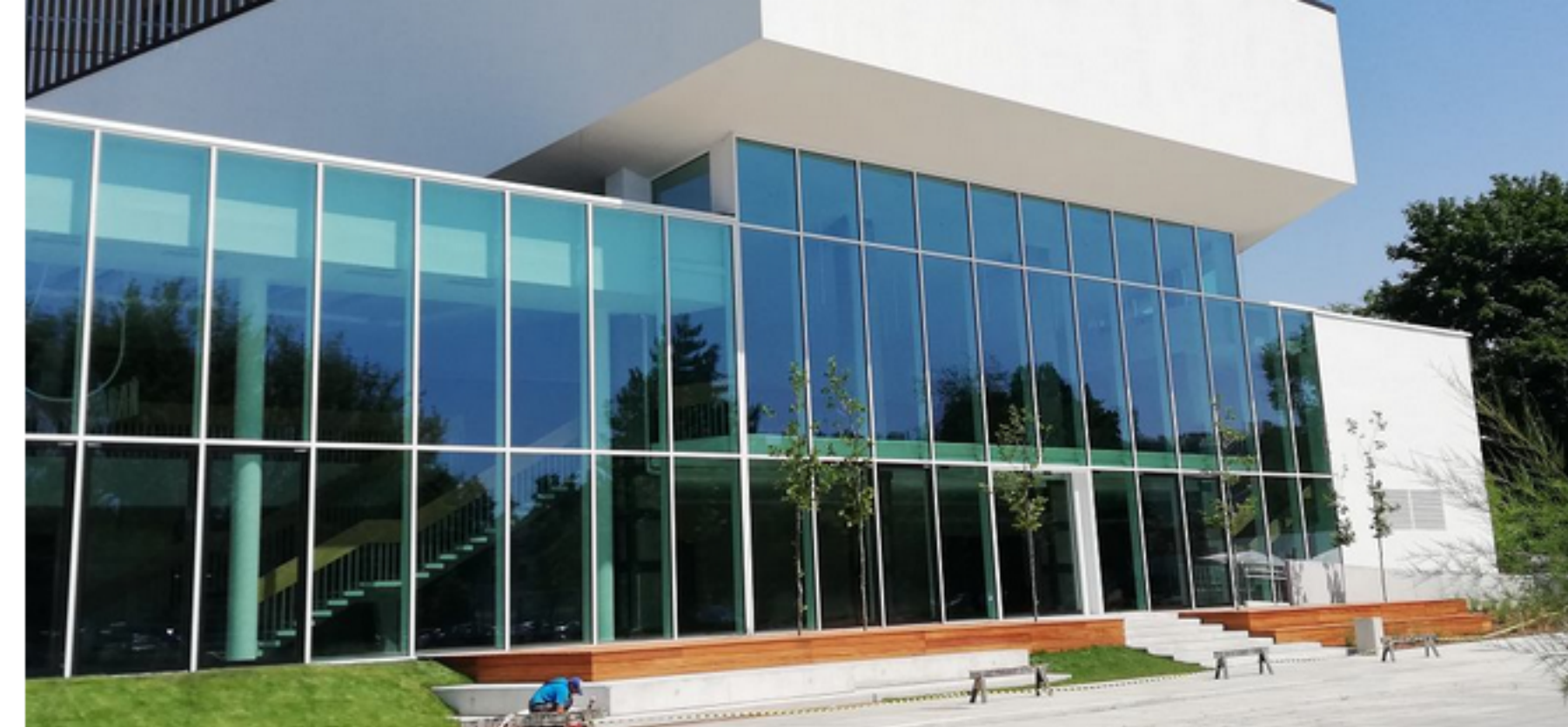
• Teatr Kochanowskiego w Opolu