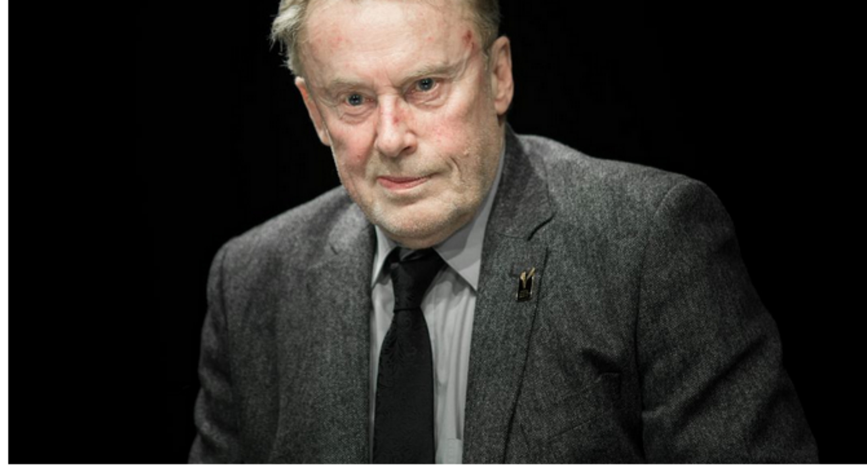
• Daniel Olbrychski